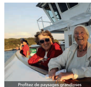
Profitez de paysages grandioses

Itinéraire détaillé jour par jour, p. 30 à 33